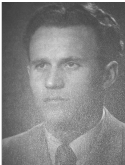
Max von der Grün (1956)

»Es gibt Erinnerungen, die bleiben, wie ein eingebranntes Mal.« 14 – Die Ausgrenzungen und Repressalien in der Schule, die Verhaftung seines Vaters und die Erfahrungen der Familie mit der NS-Herrschaft ließen von der Grün zum Antifaschisten reifen, der sich gegen die Unterdrückung von Minderheiten einsetzte und vor den neuen-alten Nazis warnte. 15 »Wer sich der Vergangenheit nicht erinnert, ist verurteilt, es noch einmal zu erleben.« 16