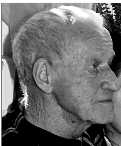
Max von der Grün (2003)

literarische Vorlage zur Verfilmung von Irrlicht und Feuer (1966). Es folgten u.a. der Große Kulturpreis der Stadt Nürnberg (1973), der Preis der Prager Fernsehzuschauer auf dem Fernsehfestival in Prag 1978 für die Verfilmung seines Jugendbuches Vorstadtkrokodile , der Wilhelmine-Lübke-Preis (1980) für Späte Liebe , die Reinoldus-Plakette – auch »Eiserner Reinoldus« genannt – des Pressevereins Ruhr (1982) und der Reinoldus-Ehrenring der Stadt Dortmund (1987), der Gerrit-Engelke-Preis der Stadt Hannover (1985), den Verdienstorden des Landes NRW (1991) und schließlich der Kogge-Preis der Stadt Minden (1998). Die größten Anerkennungen erhielt er wohl 1981 mit der Verleihung des Annette-von-Droste-Hülshoff-Preises (Westfälischer Literaturpreis) und 1988 als mit dem 10 000 DM dotierten Literaturpreis Ruhrgebiet sein Gesamtwerk gewürdigt wurde. Ehrung war ihm bestimmt auch der nach ihm benannte Preis, den die Arbeitskammer Oberösterreich und Linzer Veranstaltungsgesellschaft von 1976 bis 1998 als Max-von-der-Grün für Literatur zur Arbeitswelt in Linz verlieh – Max von der Grün gehörte auch der Jury an.